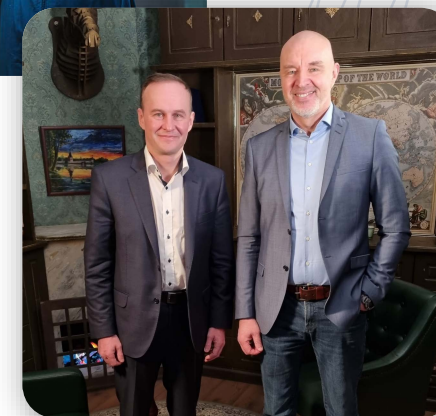
Сергей Рязанский Российский космонавт