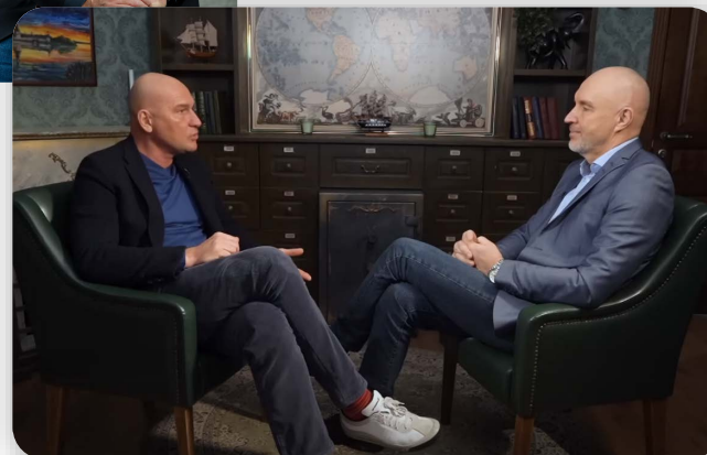
Радислав Гандапас Специалист по лидерству