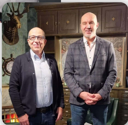
Игорь Манн Маркетолог №1 в России